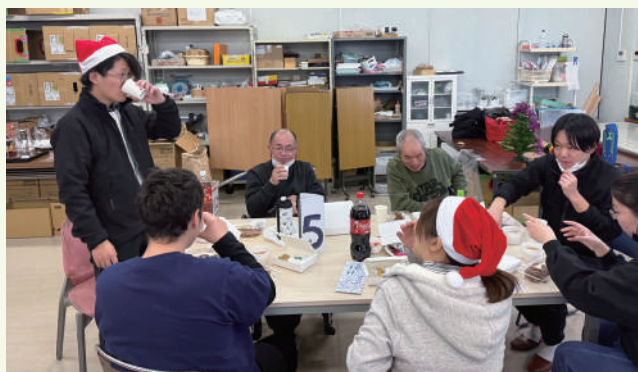
※掲載写真については、皆様から許可をいただいた上、掲載しております。