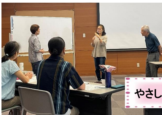
やさしい手話講座