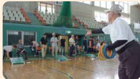
シニアクラブ輪投げ大会