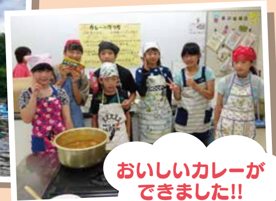
おいしいカレーが できました!!

7月28日(日)子ども交流事業を開催しました! 青空の下、元気に楽しく活動してくれた皆さんの笑顔に、沢山のパワーをもらいま した。ご参加ありがとうございました。