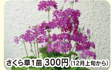
さくら草1苗 300円(12月上旬から)