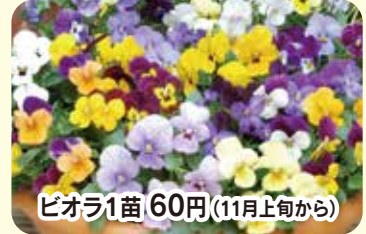
ピオラ1苗 60円(11月上旬から)