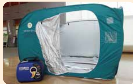
災害用備品の整備(パーティーション、発電機)