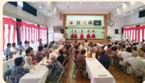
敬老会(伊王野地区)