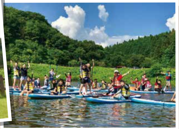
矢ノ目ダムにて SUP体験!!