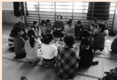
高齢者と児童生徒との交流事業