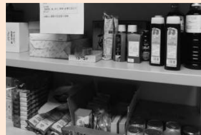
ミニフードバンク事業