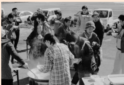
地区社協活動(防災学習会)