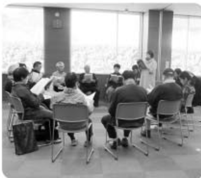
ボランティア連絡協議会 学習会