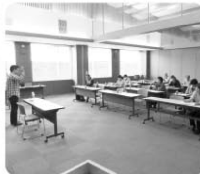
障害児者親の会 学習会