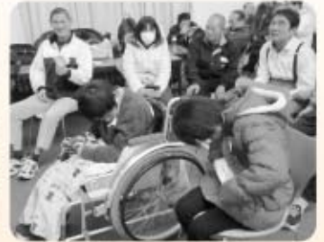
ビンゴゲーム・〇×ゲーム