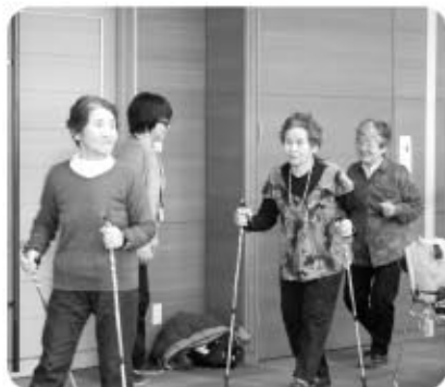
母子寡婦福祉会 健康体操