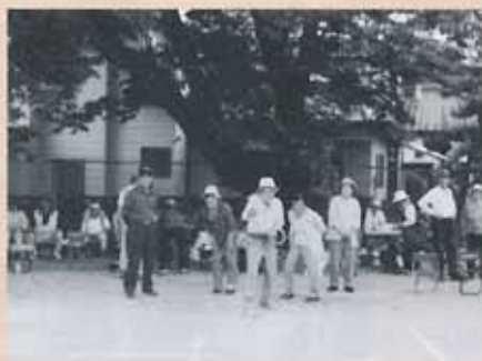
老人クラブ 輪投げ大会