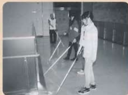
視覚障害者 お役立ち講座