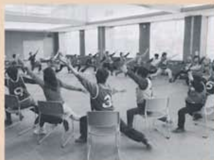
母子寡婦福祉会 交流会