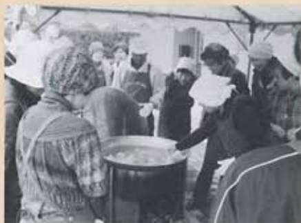
ボランティア連絡協議会 炊出し訓練