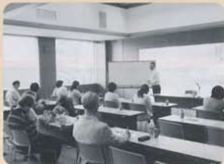
障害児者親の会 研修会