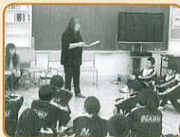
認知症サポーター養成講座(那須中)