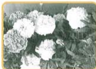
マリーゴールド 6月上旬販売 60円/苗