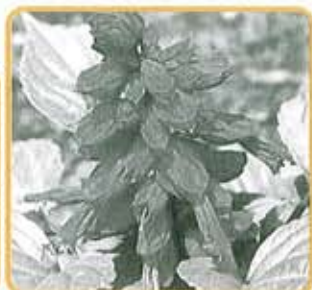
サルビア 6月下旬販売 60円/苗