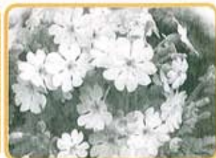
さくら草 11月上旬販売 300円/鉢

作業所では、利用者と共に、四季にあわせ種から丁寧に育て、お手ごろな価格で販売しています。庭先や地区の花壇などにいかがでしょうか。 ※花苗は、当作業所のほかみんなの店(黒田原駅前)でもお買い求めいただけます。