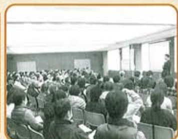
認知症サポーター養成講座(一般)