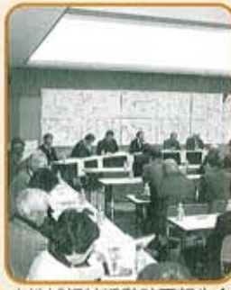
小地域福祉活動計画報告会