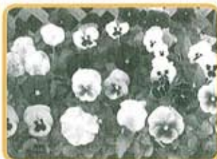
パンジー 11月上旬販売 60円/苗