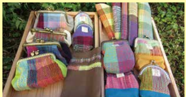
▲ さをり織り各種 (ブックカバー、小銭入れ、ペンケースなど)