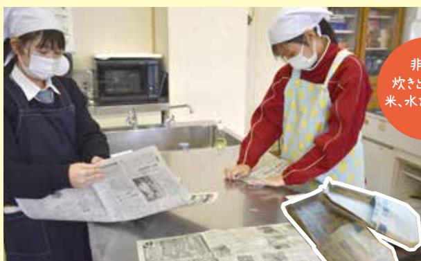
▲新聞紙簡易スリッパ作り