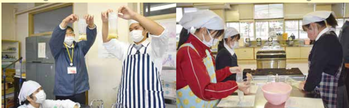
▲目の高さで水量を確認