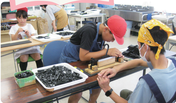
ハンガー組立作業