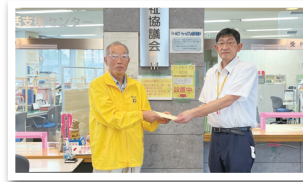
(公社) 那須町シルバー人材センター様