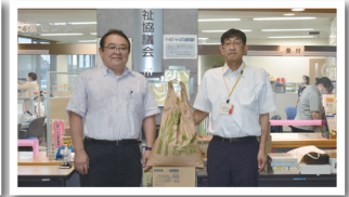
4R・2Zライオンズクラブ様