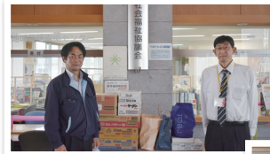
黒磯ライオンズクラブ様