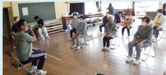
健康セミナー&元気アップスポーツ広場

大沢地区では、健康の維持・向上や地域住民の交流を目的として「健康セミナー」と「元気アップスポーツ広場」を定期的に開催しています。専門職の先生方にご指導いただく出前講座やアンチフレイル体操、グラウンドゴルフ、レクリエーション等を通じて、運動する習慣を身につけましょう！