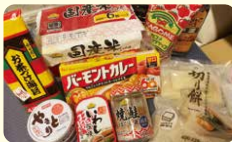
ミニフードバンク事業