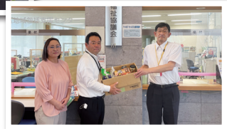
サッポロビール(株)那須工場様