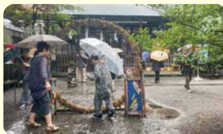
母子寡婦福祉会 会員研修会