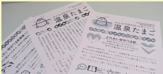
地区社協だより「温泉たまご」

湯本地区社協では、今までふれあいルームや防災学習会などを開催してきました。 そのような取り組みを地域の皆さんに広く知っていただくことを目的に湯本地区社協だより「温泉たまご」を発行しています。