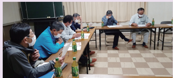
美野沢地区地域福祉活動計画策定委員会

昨年度小地域福祉活動計画を策定しましたので、今期は高齢者の見守り活動やふれあいルームなどの活動を行い、安心して暮らせる地域を目指します。