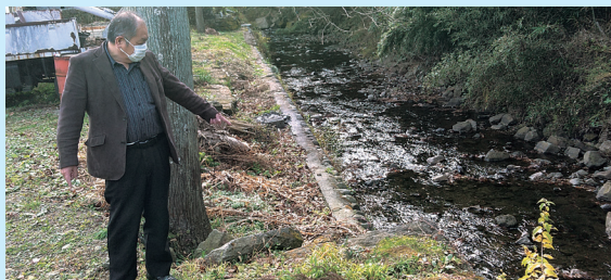
防災学習会(防災さんぽ)

台風19号で被災した場所を視視確認し、地図に写真をマッピングすることで寄居地区版のハザードマップを作成しました。 今期計画でもこのような防災活動を継続していきます。