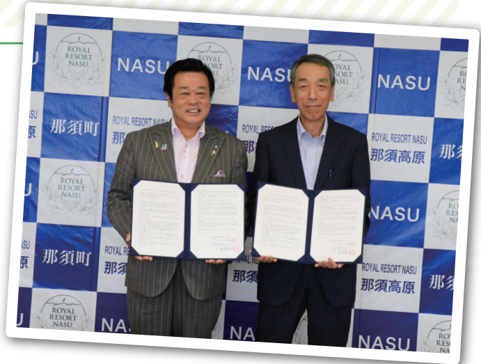
左から平山町長、阿部会長

この協定は、改めて町との連携を強固なものとし、円滑にボランティア活動を実施して、被災者の生活支援に寄与することを目的として締結しました。