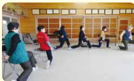
辻室地区 ふれあいルーム