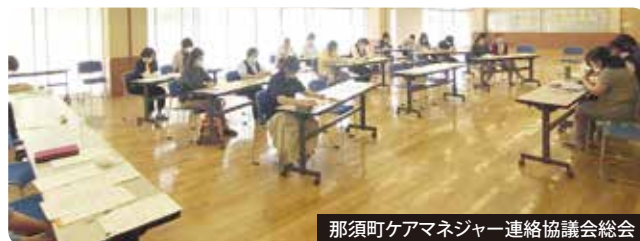
那須町ケアマネジャー連絡協議会総会

また、ケアマネジャーを対象とした研修会を実施しているほか、ケアマネジャーのネットワークづくりの支援なども行っています。