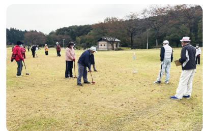
シニアクラブ連合会