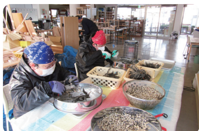
りんどう作業所 (ムクナ豆作業風景)