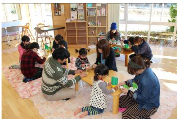
子育て支援センター